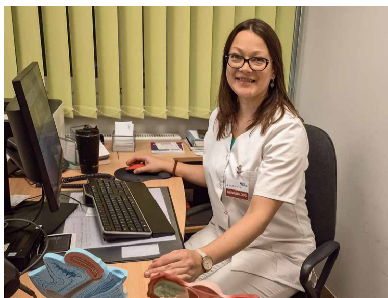
NAISTEARST KÄTLIN OTTI.

Esimest korda tuleks günekoloogilisele läbivaatusele tulla siis, kui seksuaalelu on alanud või on lähitulevikus plaanis seksuaalelu alustada ja soovitakse tõhusat rasedustamisvastast vahendit kasuta-