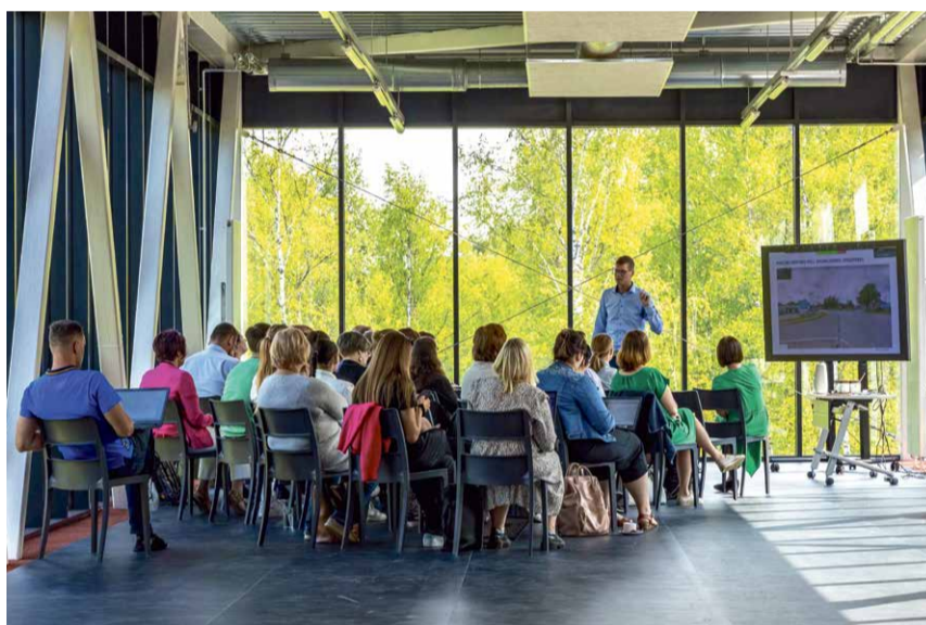
KOOSLOOMESEMINAR ELVA SPORDIHOONE GALERIIS.