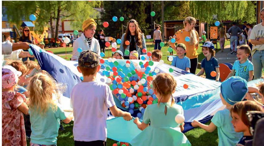
SMUUTI TEGEMINE TEEMATOAS HOMMIK.

Õppeaasta teemat „Õnneseen ajarattal“ kokkuvõtval perepool Elva maja õuealal mängisid Bingot kõik kokkutulnud perekonnad. Iga rühm oli üles seadnud ühe ajaga seotud teematoa. Alustasime vahva kontserdiga, kus rõõmustati saabunud kevade üle, lauldi ja tantsiti