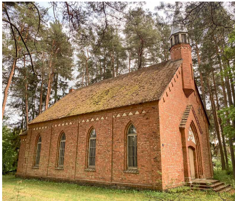
ELVA KIRIK PRAEGU.

Nõukogude ajal kogudused projekte ei kirjutanud. Kuid ei olnud keelatud materjalide ost ettevõtte-