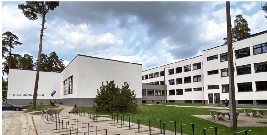
ELVA GÜMNAASIUMI PUIESTEE TÄNAVA ÕPPEHOONE.

Spordihoones ruumidesse paigutatakse just 1. klassid, kuna nende koolipäev on lühem kui teistel. Samuti on 1. klassi õpilaste koolimööbel väikesem ja kergesti liigutatav.