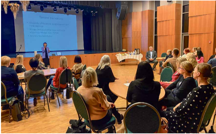
KAASAMISSEMINAR 18. JAANUARIL.