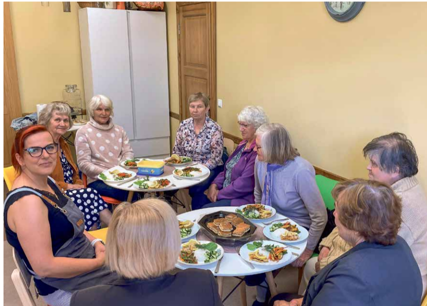
RÕNGU EAKAD PEALE EDUKAT KOKKAMIST.

Rõngu Eakate Päevakeskus saab kokku igal teisipäeval alates kella 10 ja lõpu aeg on alati varieeruv. Maja ukseid on meie vahvatele eakatele avatud muidugi hi-