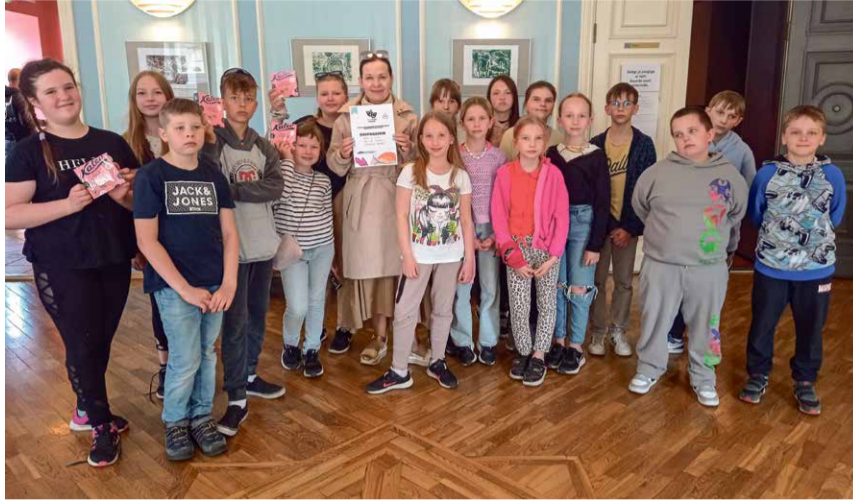
ERIPREEMIA KÕIGE LAHEDAMA RÄPILOO EEST.

Kevade hakul hakkas Rõngu Keskkoolis tegutsema üks vahva näitetrupp, eesmärgiga esineda 13. aprillil toimival maakondlikul teatripäeval Rõngu rahvamajas.