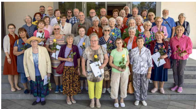
VÄÄRIKATE ÜLIKOOLI LÕPUAKTUS.