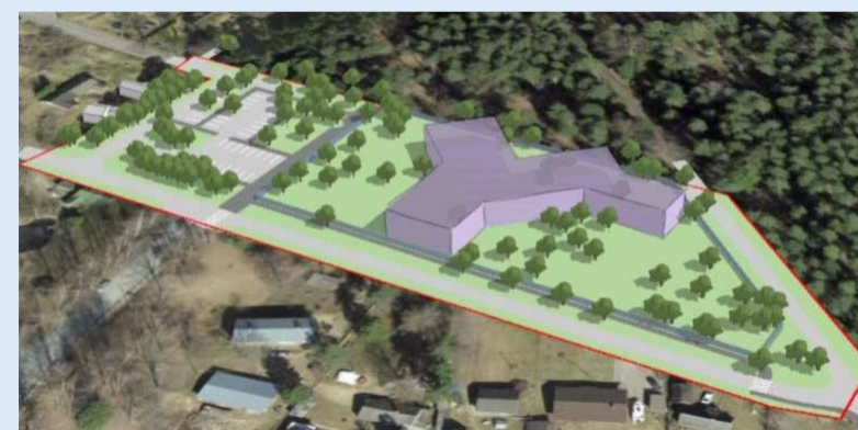
KADAKA 10 DETAILPLANEERINGU LAHENDUSE MAHULINE ILLUSTRATSIOON.

Kadaka 10 kinnistu detailplaneeringuga kavandatakse krundile koolieelse lasteasutuse rajamist. Lisaks lasteaiahoonele on lubatud täiendavalt paviljonide, varjualuste ning mängu- ja spordiväljakute rajamine. Parkimislahenduse kavandamisel tagatakse väljakujunenud jalakäijate liikumistee läbi Kadaka 10 kinnistu.