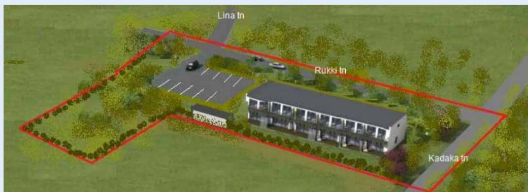
RUKKI 2A KRUNDI DETAILPLANEERINGU LAHENDUSE MAHULINE ILLUSTRATSIOON.

Elva Vallavolikogu kehtestas 16. detsembri istungil Käärdi alevikus, Rukki tänav 2a krundi detailplaneeringu, millega antakse krundile ehitusõigus ühe ridaelamu ehitamiseks. Detailplaneeringuga muudetakse osaliselt Rõngu valla üldplaneeringut. Kehtestatud detailplaneeringu ja üldplaneeringu muudatuse ettepanekuga on võimalik tutvuda Elva Vallavalitsuse arengu- ja planeeringuosakonnas (Kesk 32, Elva linn) ja veebilehel www.elva.ee/detailplaneeringud .