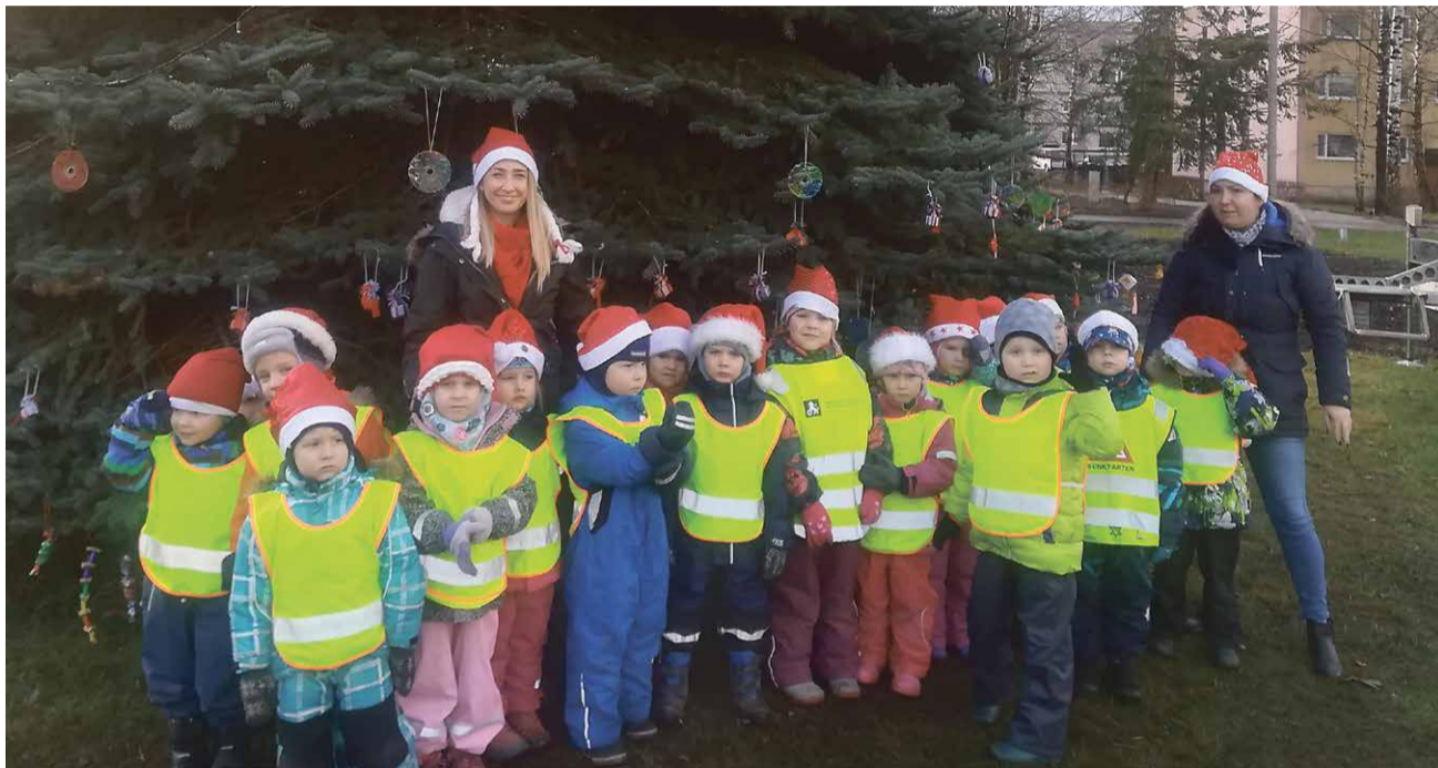
ÕNNELILLE RÜHM EHTIMAS PUHJA ALEVIKU KUUSEPUUD.

2019. aasta oli Pääsusilma lasteaiale juubeliaasta. Rühmad osalesid mitmetes projektides, käisid matkamas, võtsid osa maakondlikust laste rahvatantsupeost ning maakondlikust spordi- ja tervisepäevast. Kooliminejad lapsed käisid metsa istutamas, toimus tore Mihkli- ja taimelaat koos lastevanemate ning hoolekoguga. Korraldatud sai ka Puhja lasteaiale