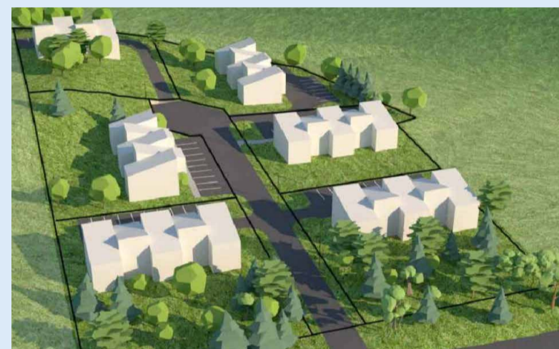
JÄRVE 9 DETAILPLANEERINGU LAHENDUSE MAHULINE ILLUSTRATSIOON.

Järve 9 kinnistu detailplaneeringuga kavandatakse kinnistu jagamist kuueks elamu- ja üheks tänavakrundiks. Elamukruntidele antakse ehitusõigus ridaelamute ehitamiseks. Kruntide teenindamiseks nähakse ette avalikus kasutuses tupiktäna ehitamine.