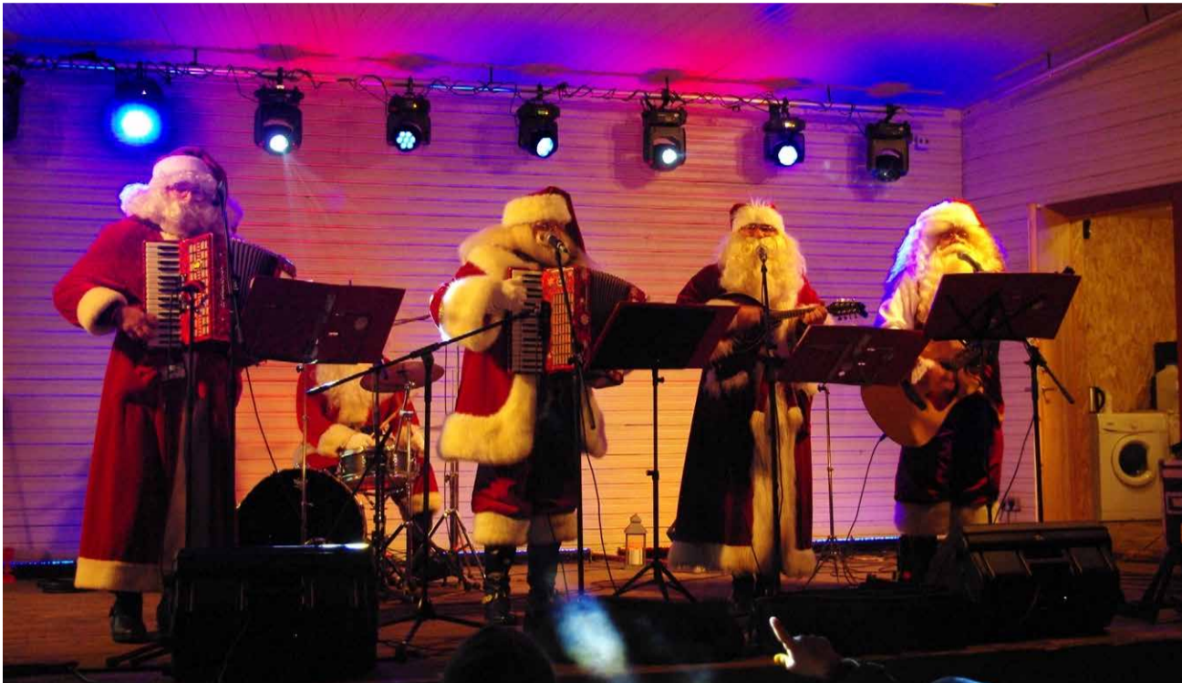
TAADID ON ÜHENDANUD OMA PILLIOSKUSED, LAULUHÄÄLED JA ELLU KUTSUNUD VAHVA ORKESTRI.