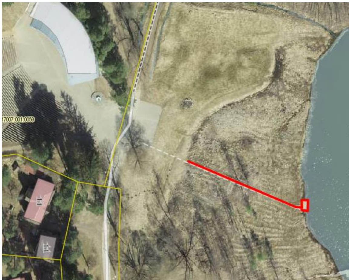
Joonis 2. Punase joonega on tähistatud rajatava laudtee ja purde asukoht.

2. Asukoht: Elva linn, Arbi järve (17007:001:0068).