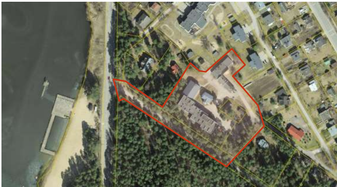
Väljavõte: Maa-amet 2018

Planeeritav ala koosneb 4 kinnistust. Kokku on planeeringuala pindala ligikaudu 15 834 m 2 .