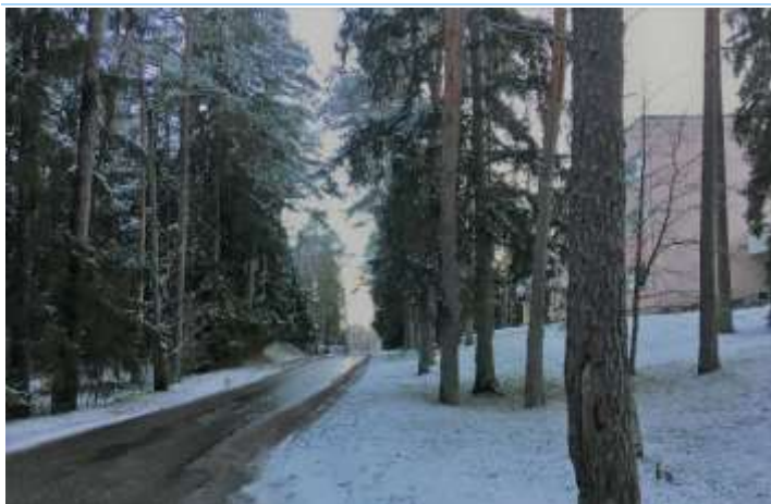
Foto 1 Vaade Supelranna tänavale

Parkimine toimub Supelranna 19//21//23 kinnistul piki krundi piiri asfalteeritud alal, kus parkimiskohti kokku ca 23. Markeeritud parkimiskohad Supelranna T1 tänaval puuduvad, kuid inimesed pargivad seal piki Supelranna tn 15 kinnistu äärt (4 kohta). Parkimine on korraldatud ka Supelranna tänava tänavamaa-alal piki Kalda tn 2 kinnistu piiri. Parkimist illustreerivad fotod 2-5 (seisuga 03.01.2019). Supelranna tänaval on parkimiseks ette nähtud ala kaetud kruusaga, parkimine toimub 90kraadise nurga all ning ala mahutab ca 11 sõidukit.