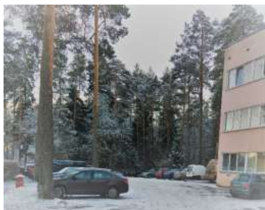
Foto 3 Parkimine Supelranna 19//21//23 krundil