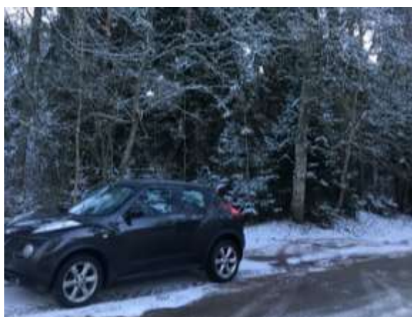
Foto 4 Parkimine piki Supelranna 15 krundi piiri