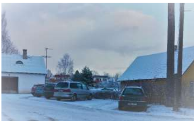
Foto 2 Parkimine Supelranna 19//21//23 krundil

Parkimine toimub Supelranna 19//21//23 kinnistul piki krundi piiri asfalteeritud alal, kus parkimiskohti kokku ca 23. Markeeritud parkimiskohad Supelranna T1 tänaval puuduvad, kuid inimesed pargivad seal piki Supelranna tn 15 kinnistu äärt (4 kohta). Parkimine on korraldatud ka Supelranna tänava tänavamaa-alal piki Kalda tn 2 kinnistu piiri. Parkimist illustreerivad fotod 2-5 (seisuga 03.01.2019). Supelranna tänaval on parkimiseks ette nähtud ala kaetud kruusaga, parkimine toimub 90kraadise nurga all ning ala mahutab ca 11 sõidukit.