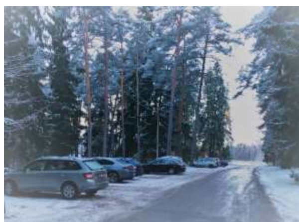
Foto 5 Parkimine Supelranna tänaval

Olemasolevatest tehnovõrkudest on planeeringualal olemas ühendused ühisvee- ja ühiskanaliseerimisvõrgu, sidevõrgu ja elektrivõrguga. Soojavarustus on lahendatud lokaalselt.