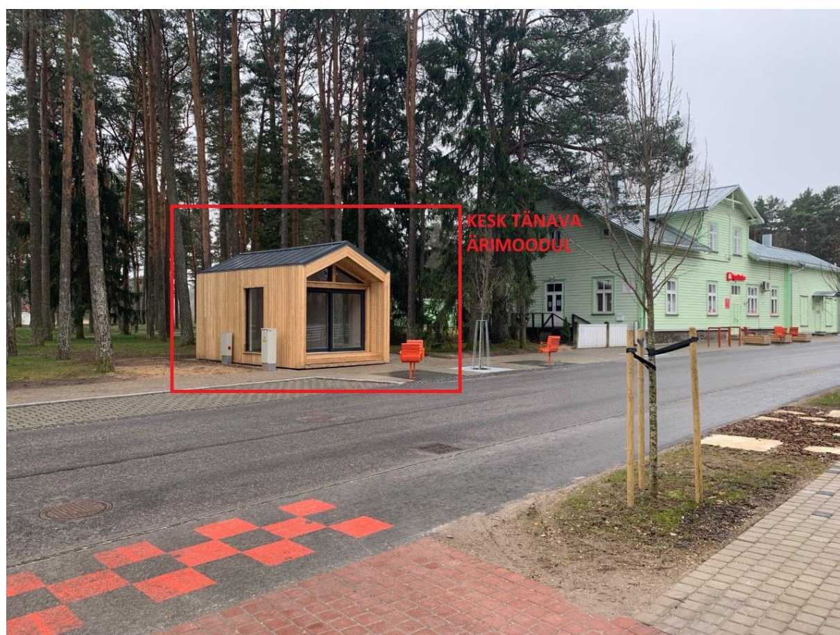
Vaade Kesk tänava ärimoodulile.