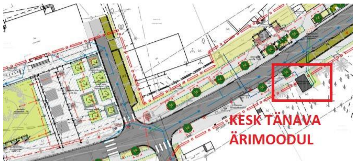
Kaart: Kesk tänava ärimooduli paiknemine