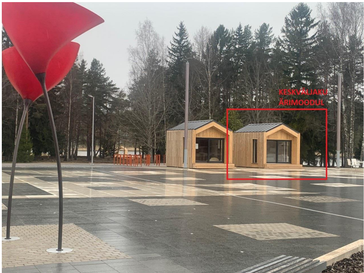
Vaade Keskväljaku ärimoodulile