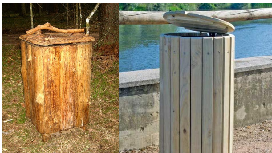
Joonis 7 Nädispildid prügikastidest

5.1 Kogus 2 tk. Pealt kaanega, puidust, ilmastikukindel, mahutavus vähemalt 60l . Paigaldada põhjaga mitte otse vastu maapinda.