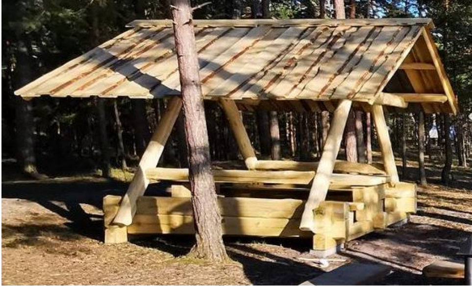
Joonis 1 Näidispilt varjualusesest

1.1 Kogus 2 tk. Varjualuse keskel peab olema laud ja istepingid kahel pool.