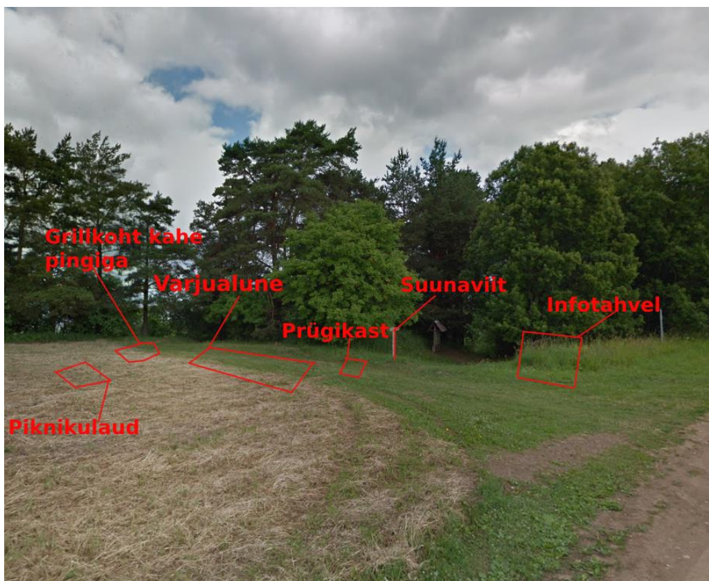
Joonis 10 Ligikaudne objektide paigaldus puhkekohta 1