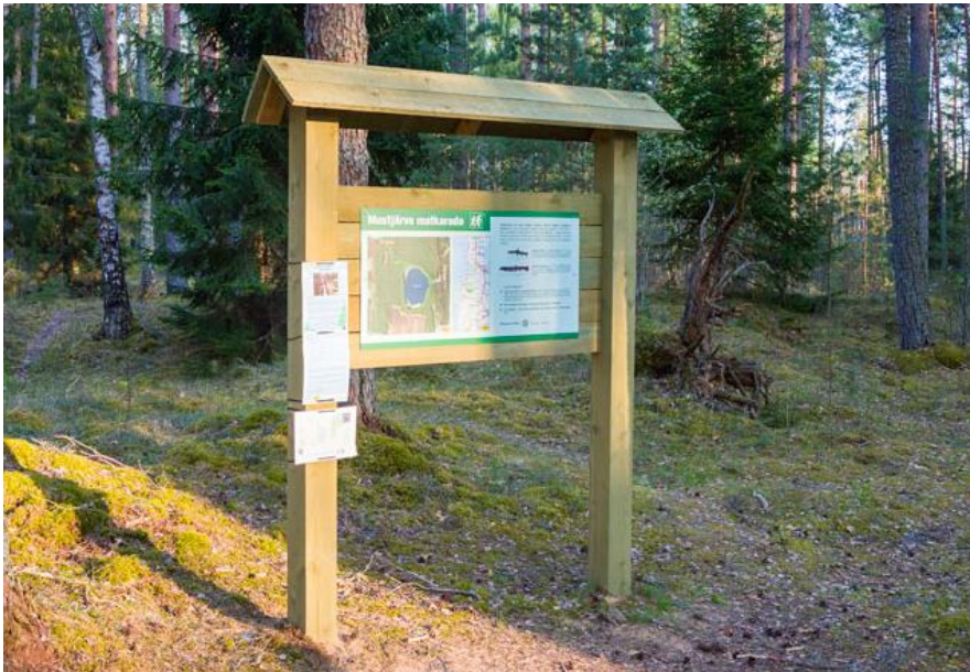
Joonis 5 Näidispiilt infotahvlist

3.2 Infotahvel 1 tk. Mõõdud vähemalt 1300x1000 mm. Immutatud puidust, katusega. Töövõtja kujundab ja prindib info ilmastikukindlale alusele. Kujundus ja infotahvilil olev info kooskõlastatakse eelnevalt tellijaga.