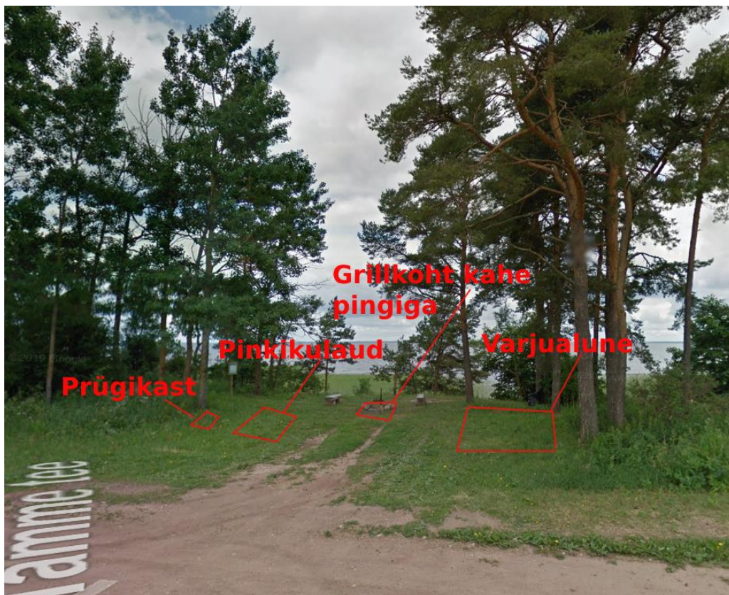
Joonis 11 Ligikaudne objektide paigaldus puhkekohta 2