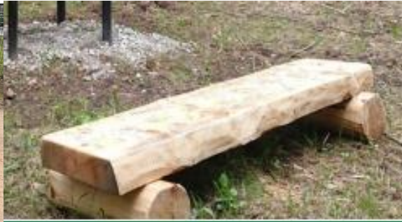
Joonis 3 Näidispilt pingist