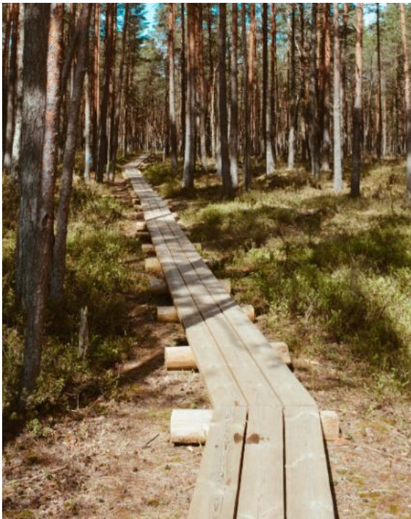
Joonis 8 Näidispilt laudteest

Tööde korraldamisel ning materjali transportimisel tuleb arvestada konkreetseid ilmastiku- ja loodusolusid ning valida vastavalt olukorrale sobiv võimalus laudtee paigalduseks, millega ei kahjustata pinnast.