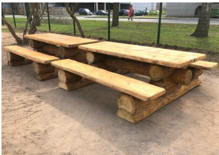
Joonis 2 Näidispilt pikkikulauast