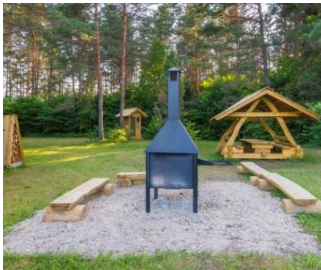
Joonis 6 Nädispildid grillist