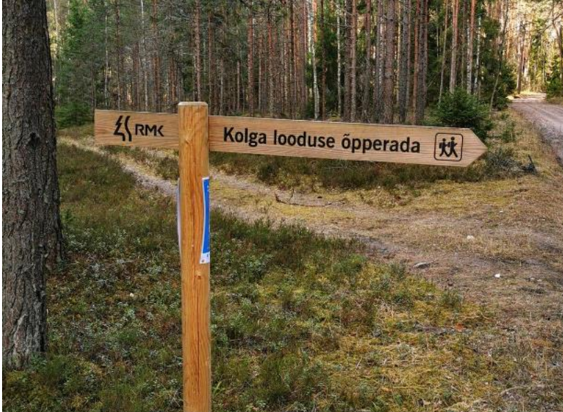
Joonis 4 Näidispiilt teeviidast

3.1 Teeviit 2 tk - „Elva vald + valla logo. Tamme paljandi matkarada“. Kahepoolne. Üks paigaldatakse raja algusesse ja teine raja keskele, täpne asukoht kooskõlastatakse Tellijaga kohapeal.